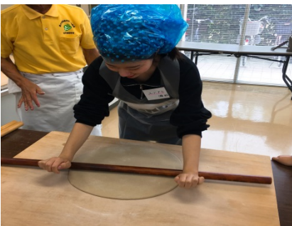
7月 日本食 そば打ち体験