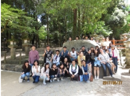
5月 国際交流バスツアー