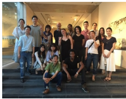
7月 留学生と日本人学生とのアート展