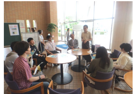
6月 留学生によるお国紹介 (ミャンマーについて)