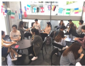
国際交流センター