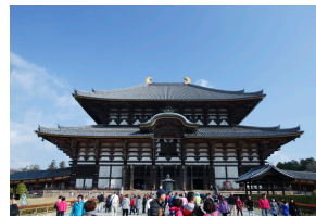
大学から電車で約 80 分