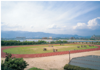
西宮浜グラウンド