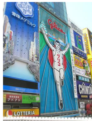
大学から電車で約 40 分