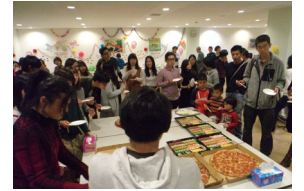
クリスマスパーティ