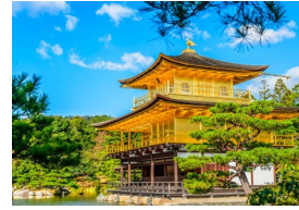
大学から電車で約 50 分