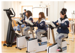
トレーニングジム