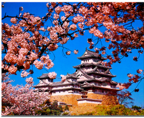
大学から電車で約 60 分